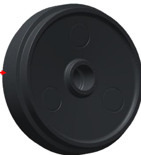
CARÇA RODA GUIA