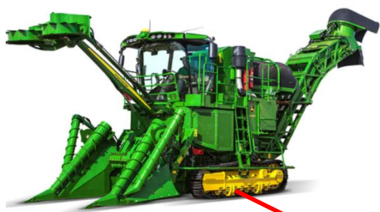
Exemplo de Equipamentos